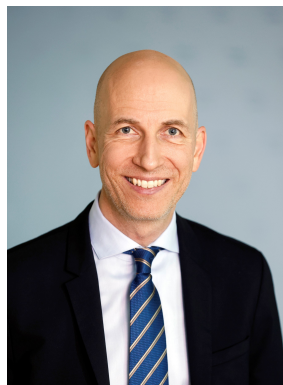
Bundesminister Univ.-Prof. Dr. Martin Kocher

Arbeitnehmerinnen und Arbeitnehmer können ihre Arbeitszeit nach Vereinbarung mit ihrer Arbeitgeberin oder ihrem Arbeitgeber für eine gewisse Zeit reduzieren und sich so schrittweise wieder in den Arbeitsalltag einfinden, ohne sozialversicherungsrechtliche und erhebliche finanzielle Einbußen hinnehmen zu müssen. Vorteile gibt es auch aus betrieblicher Sicht: Mit einer frühzeitigen Wiedereingliederung können Unternehmen schneller wieder auf erfahrene Mitarbeiterinnen und Mitarbeiter zurückgreifen. Im Ergebnis also eine Win-Win-Situation sowohl für Beschäftigte als auch für Betriebe. Die Wiedereingliederungsteilzeit soll darüber hinaus eine Anhebung des faktischen Pensionsantrittsalters und eine Erhöhung der Beschäftigungsquote Älterer bewirken und damit zur langfristigen Sicherung des gesetzlichen Pensionssystems beitragen.