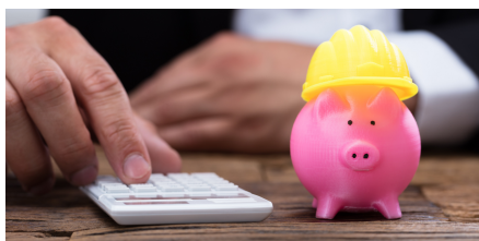
Folgekosten von Arbeitsunfällen

"Gesundheit im Betrieb" spart Kosten – für Betriebe, Beschäftigte und Gesellschaft. 9,9 Mrd. Euro an Kosten fallen in Österreich jährlich aufgrund der Folgen von arbeitsbedingten Erkrankungen und Arbeitsunfällen an. Diese Kosten werden von Betrieben, Beschäftigten und dem Sozialsystem gemeinsam getragen.